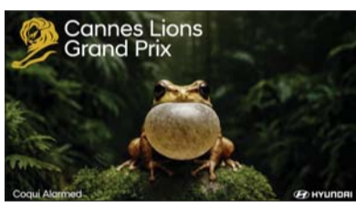
현대차 캠페인 이미지.

목받지 못했던 바다 숲에 지명을 부여하고, 이를 지도 서비스에 반영하는 사회 공헌 캠페인이다.