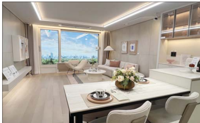
‘장위 푸르지오 마크원’ 견본주택 74㎡ B타입 거실.