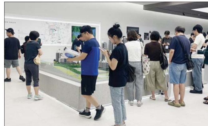
견본주택 방문객들이 단지 모형을 살펴보고 있다.

지하철 6호선 돌곶이역 역세권 총 1931가구 중 1032가구 일반 15개 구역 개발 완료시 3만가구 최고 분양가 7.5억~21.7억 수준 “국평 17억 비싸다고 인식 했지만 현 시세와 비교시 수용 가능 수준”