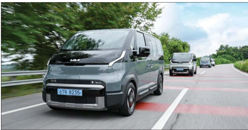
기아 PV5 패신저 모델 주행모습.

오토카는 PV5 패신저 수상 이유에 대해 신선하고 미래지향적인 스타일링, 예상을 뛰어넘는 세련된 주행감, 효율성이 돋보이는 실내 레이아웃에 주목하며 E-GMP.S 플랫폼을 기반으로 확보한 동력성과 주행거리, 가격 경쟁력까지 갖춰 전동화 다목적 차량(MPV) 및 경상용차(LCV) 시장에서 새로운 기준을 제시했다고 밝혔다.