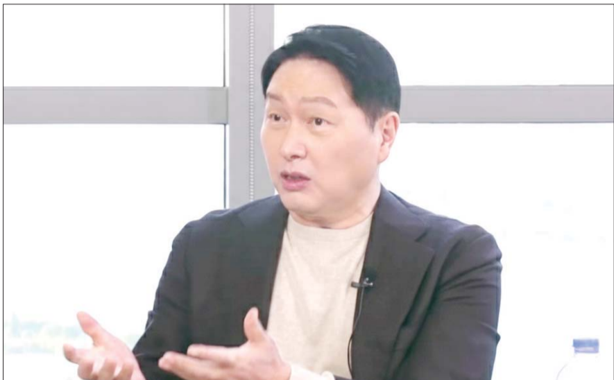
최태원 SK그룹 회장.

최 회장은 9일 일본 도쿄 제국호텔에서 열린 닛케이포럼 '한일특별세션'에 참석해 정·재계 인사들과 함께 양국 협력 방안을 논의했다. 이번 행사는 일본 경제지 닛케이가 주최하고 SK그룹과 최종현학술원이 기획했으며, 양국 정·재계 인사 300여 명이 참석했다.