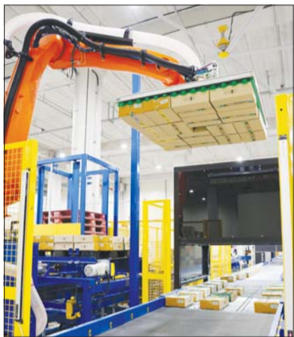
현대홈쇼핑 화성 물류센터에서 로봇팔과 싱글레이터를 활용해 상품을 하역하는 모습.