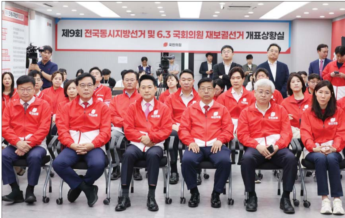
장동혁 국민의힘 대표와 선거대책위원회 관계자들이 3일 오후 서울 여의도 중앙당사에서 6·3 지방선거와 재보궐선거 출구조사 결과 방송을 보고 있다.