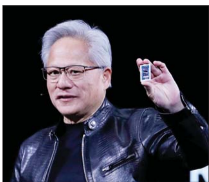
젠슨 황 엔비디아 최고경영자(CEO)가 지난 1일(현지 시간) 대만 타이베이에서 열린 정보기술(IT) 박람회 ‘컴퓨텍스 2026’ 기조연설을 하고 있다.

내일 SK·LG·네이버 등 총수 만나 로봇·피지컬AI 등 협력 확대 전망