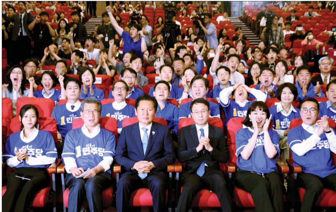
정청래 더불어민주당 총괄상임선대위원장과 위원들이 3일 오후 서울 여의도 국회 의원회관에 마련된 개표 상황실에서 제9회 전국동시지방선거 출구조사 결과 발표를 시청하고 있다.

2002년 5월 31일 창간 독자센터 (02)721-9841 구독료: 월 20,000원 / 1부 1,000원 뉴메트로 10주년 대한민국 희망을 찾아서 2026년 6월 4일 목요일