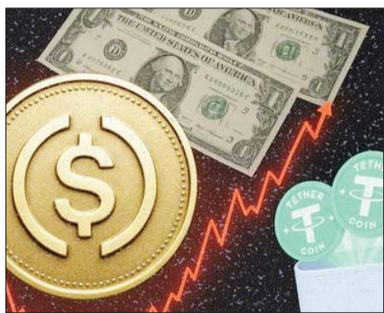
스테이블코인 발행 허용을 비롯한 ‘가상자산 선진화’ 논의가 활성화됐다.

민주당, 6·3 선거 직후 입법 목표 가상자산의 법적 지위 정립 등 포함 스테이블코인 범죄 악용사례 늘어 원화 발행시 규제 방향성 논의돼야