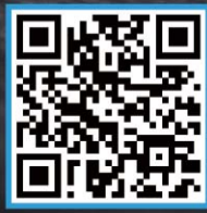
삼성생명 IRP 가입하기

직장인에게 퇴직연금은 그냥 돈이 아니니까 수익률과 안정성, 전문성과 고객편의까지 퇴직연금이 갖춰야 할 모든 능력 튼튼한 삼성생명에 있습니다.