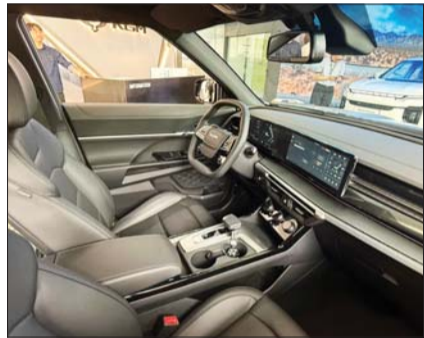
뉴 토레스의 실내 모습.

우선 운전자의 편의성 강화를 위해 '아테나 2.5' 인포테인먼트 시스템과 최첨단 안전 편의 사양을 적용했다. ▲무선 안드로이드 오토 ▲무선 애플 카플레이 ▲듀얼 휴대폰 무선 충전 시스템 ▲무선 소프트웨어 업데이트(OTA)를 비롯해 ▲CE타입 USB 단자(1열 충전 1개/데이터&충전 1개, 2열 충전 2개) ▲스마트키 시스템 ▲운전석 8way 전동시트&전동식 2way 리머서포트 ▲듀얼존 풀오토 에어컨 등 선호도가 높은 편의 사양을 대거 적용해