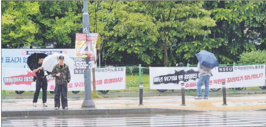
삼성전자 노사가 총파업 예정일을 하루 앞둔 20일 오후 3시경 경기 평택시 고덕동 삼성전자 평택캠퍼스 앞에 붙어있는 사측 규탄 플래카드.

생산 차질에 성장률 0.5%p 하락 우려 엔비디아·AMD 고객 이탈 가능성 中 반도체 업체 점유율 확대 우려 업계 "고객 신뢰 훼손이 더 치명적" 파업 장기화 땀 경제 부담 불가피