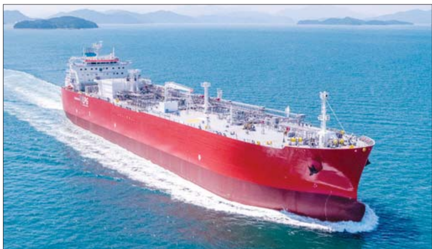
삼성중공업이 건조한 대형가스운반선.

LNG 운반선 호황에 역대급 실적 내년 이후 추가 개선 여력 제한적 특수선·방산 성과... MRO 선점 치열 해양플랜트, 선별 수주 중심 활기 AIDC 전력난 겨냥 중속엔진 속도