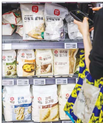
20일 서울 시내 대형마트에 밀가루가 진열되어 있다.

실제로 농심이 원맥 시세 안정을 이유로 가격 인하를 요구하자, 이들은 회합을 통해 최소 폭만 인하하기로 합의해 대응했다. 환율 상승을 이유로 인하 요구를 거절