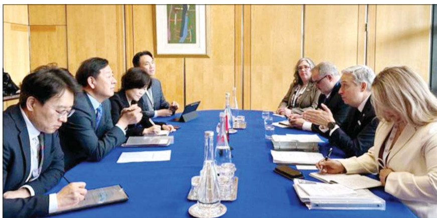
구윤철(왼쪽 2번째) 부총리 겸 재정경제부 장관이 19일(현지시간) 프랑스 파리에서 프랑수아 필립 상파뉴 캐나다 재무장관과 양자 면담을 진행하고 있다.