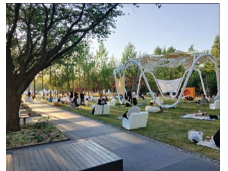
서울국제정원박람회 전디마당 휴게쉼터(서울시)

분석 결과 박람회 기간 서울숲 일대 일평균 생활인구는 약 4만2300명으로 직전 4월보다 20.4% 증가했다. 특히 주중 생활인구 증가율은 25.1%로, 특정 주말에만 인파가 몰리는 일회성 행사가 아니라 일상 속에서 찾는 축제 양상을 보였다. /이현진 기자