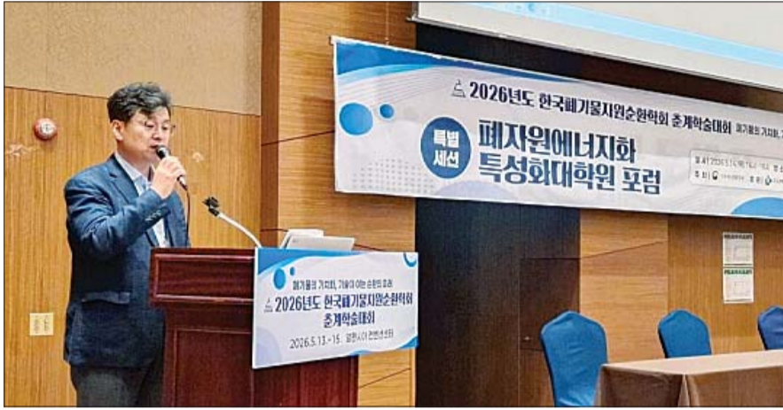
수도권매립지관리공사는 지난 14일 '2026년 폐자원에너지 특성화대학원 포럼'을 개최했다.

받은 항목은 생물학적산소요구량(BOD), 총질소(T-N), 총인(T-P), 총유기탄소(TOC) 등 수질 분야 13개 전 항목과 카드뮴, 납, 구리, 크롬 등 폐기물 분야 6개 전 항목이다.