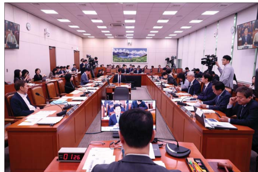
20일 오전 서울 여의도 국회에서 외교통일위원회 전체회의가 열리고 있다.

배현진 국민의힘 의원은 “이란 국영 매체는 이란 정부가 아닌 혁명수비대나 이란 내 다른 조직의 (공격) 가능성이 열려 있다고 보도했는데, 한국 입장에서는 모