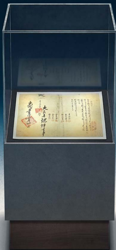
| 최초의 민족자본 은행인 대한천일은행 창립청원서 |

그 마음 그대로를 오늘의 금융에 담아 새로운 우리 금융의 역사를 써 내려가겠습니다