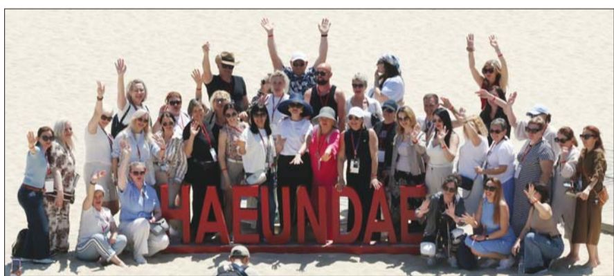
조여름 날씨를 보인 지난 13일 부산 해운대구 해운대해수욕장을 찾은 외국인 관광객들이 단체 기념사진을 찍고 있다.

백화점, 지방 점포 확장 가장 적극적 뷰티·패션, 핵심상권 대형매장 출점 외국인 관광객 관광지역 다변화 영향