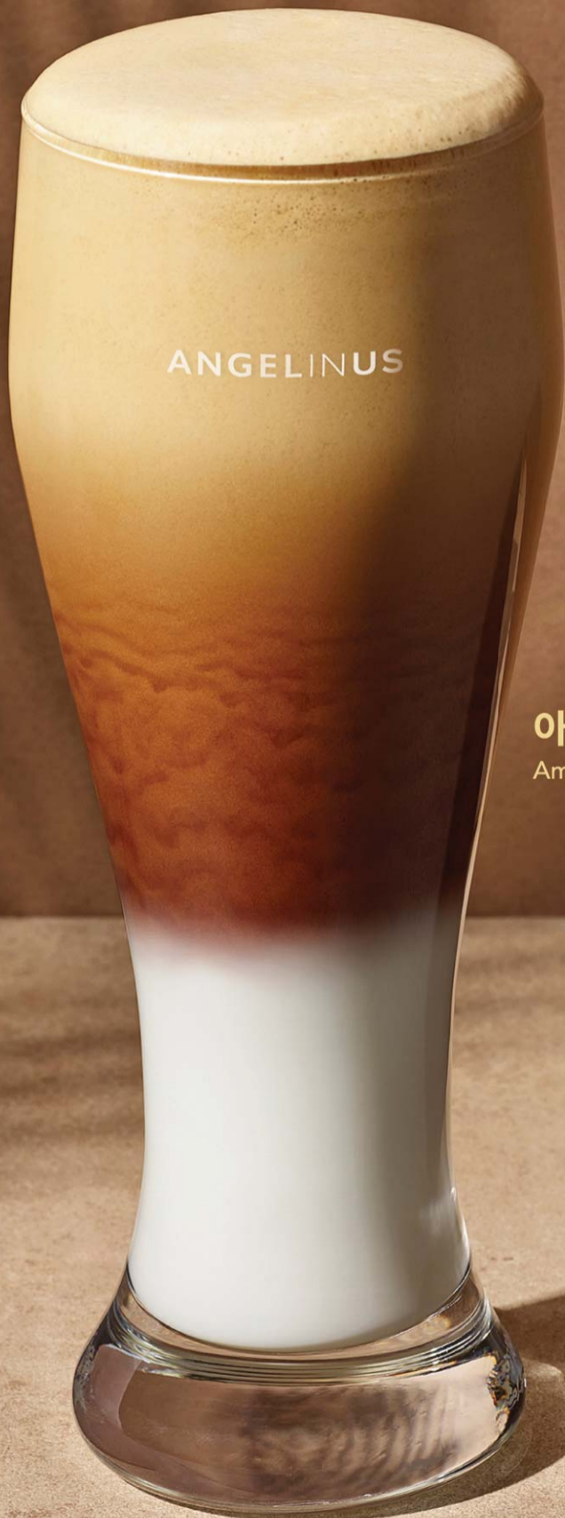
아메리치노 라떼 Americcino Latte