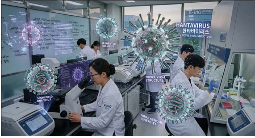
K바이오 기업들이 포스트 팬데믹에 대응하며 K백신 주권을 위한 연구개발에 집중한다.

아이진, mRNA 예방백신 과제 선정 현대바이오, '제프티' 임상 속도 셀레믹스, 유전자 분석 패널 개발