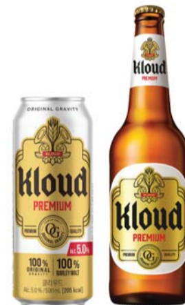
클라우드 리뉴얼 패키지.

클라우드는 독일 정통 맥주 제조방식인 '오리지널 그라비티(Original Gravit