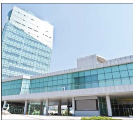
한국농수산식품유통공사 본사 전경.

감사원의 해당 심사평가는 '공공감사에 관한 법률'에 의거, 효율적인 국가감사체