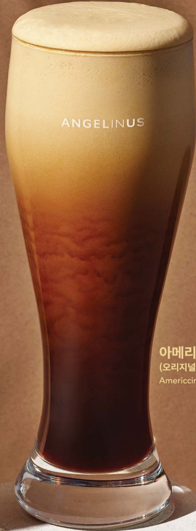
아메리치노 (오리지널 / 스위트) Americcino (Original / Sweet)