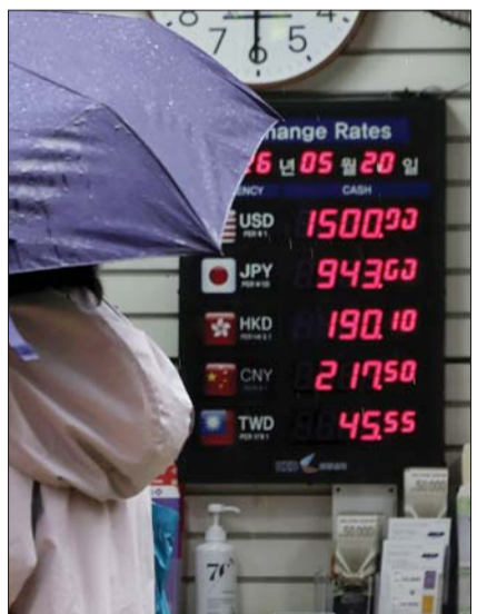
20일 서울 중구 명동 환전소에 거래 가격이 표시돼 있다.

최근의 원화값 하락은 중동사태 장기화 우려에 따른 위험자산 선호 위축 때문이다.