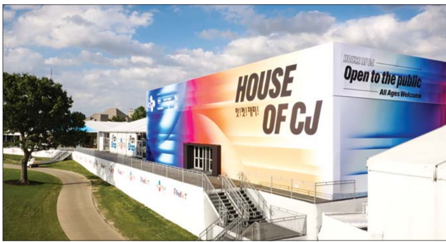
CJ그룹 통합 체험관 'HOUSE OF CJ'

텍사스 PGA 대회장 중심부 자리 식품·뷰티·엔터 등 복합경험 제공 골프 팬 점점 확대... 북미진출 박차