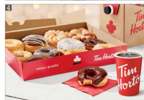
1 전 매장에서 운영중인 팀스키친. 2 팀홀튼 블랙 커피. 3 팀홀튼이 전개한 빨강머리앤 캠페인. 4 팀홀튼 시그니처 도넛 라인업.