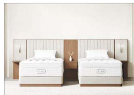
코웨이 비렉스 스위트 호텔 프레임 ‘뉴트럴 베이지 트리플 패널’

비렉스 스위트 호텔 프레임은 월패널을 싱글(1개), 듀얼(2개), 트리플(3개)