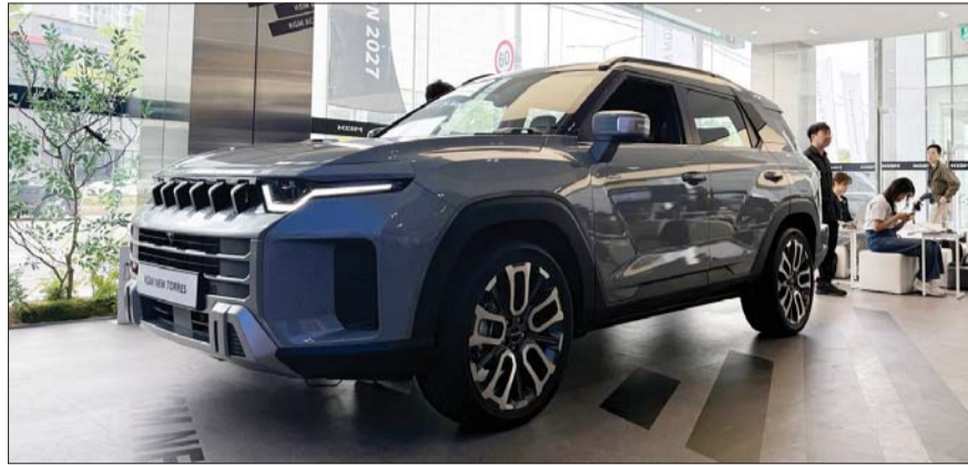
19일 경기도 고양시 KGM 익스피리언스 센터에 전시된 뉴 토레스 플리즈마 새도우 색상 모델.

특히 KGM은 주행 성능과 인포테인먼트 시스템을 강화했다. 그동안 문제점으로 지적된 ▲공조 기능 등의 과도한 디지털화로 불편해진 조작성 ▲무선 안드로이드 오토 애플 카플레이 미지원 ▲6단 변속기를 적용해 출발 시 울컥임 등을 해결했다.