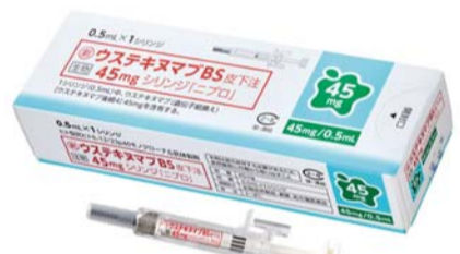
자가면역질환 치료제 'SB17' 일본 제품