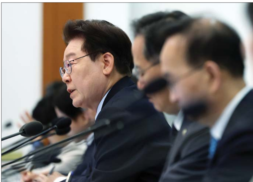
이재명 대통령이 20일 청와대에서 열린 제22회 국무회의 겸 제9차 비상경제점검회의에서 발언하고 있다.

이 대통령은 “지원봉사가겠다는 제3국 선박을 나포하고, (한국인 활동가들을) 체포해서 감금했다는 게 타당하냐”고 묻자 “거기가 이스라엘 영해냐. 이스라