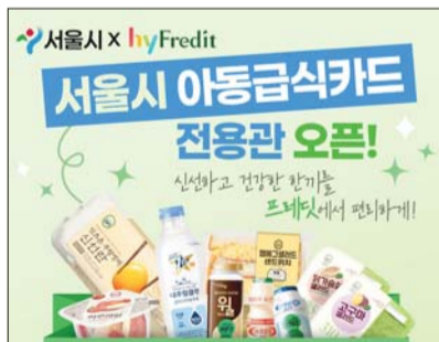
hy가 서울시 아동급식카드 전용관을 오픈했다.

hy가 서울시와 손잡고 결식 우려 아동을 위한 온라인 복지 서비스를 본격 확대한다. 기존 오프라인 중심이던 아동급식카드 사용처를 온라인으로 넓혀, 아이들이 보다 편리하게 신선식품을 구매할 수 있도록 한 것이 핵심이다.