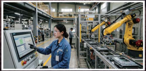
국가 첨단 전략산업 금융 지원