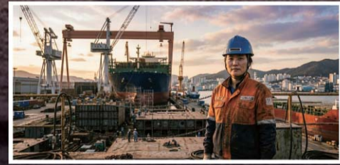
동남권 지역특화산업 육성