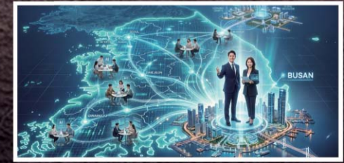
그룹 중심 스타트업 통합 지원

BNK 부산은행 BNK 경남은행 BNK 캐 피 탈 BNK 투자증권 BNK 저축은행 BNK 자산운용 BNK 벤처투자 BNK 신용정보 BNK 시 스 템 BNK 씬뉴군단