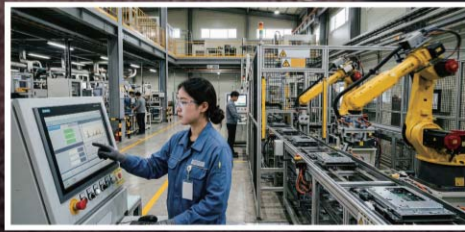
국가 첨단 전략산업 금융 지원