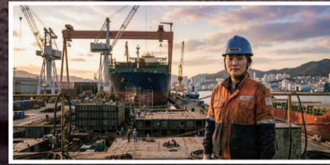
동남권 지역특화산업 육성