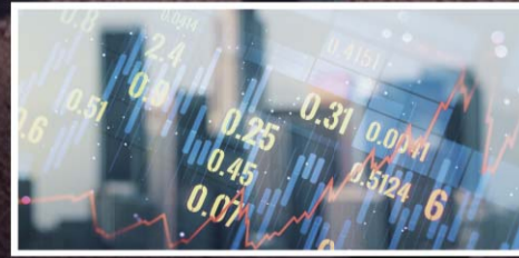
국민성장펀드 참여 확대