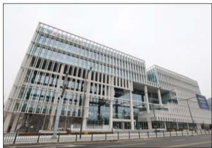
서울시교육청 용산 신청사

서울시교육청, 3단계 통합 지원 추진 사교육 의존 줄이고 정보 격차 해소