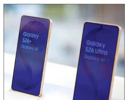
서울 강남구 삼성 강남에 진열된 갤럭시 S26 시리즈.

일각에서는 삼성전자가 갤럭시S26 시리즈의 판매 호조를 반영해 이달 생산량 확대에 나선 것으로 내다보고 있다. 회사는 지난 3월 중순 제시했던 이달 S26