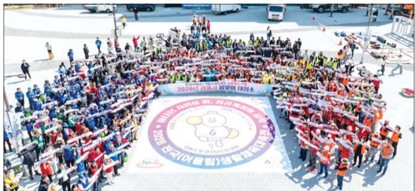
전국 생활체육 동호인 최대 축제인 '2026 전국생활체육대축전'이 오는 23일부터 4일간 주 개최지 김해시를 포함한 경남 16개 시·군에서 펼쳐진다.