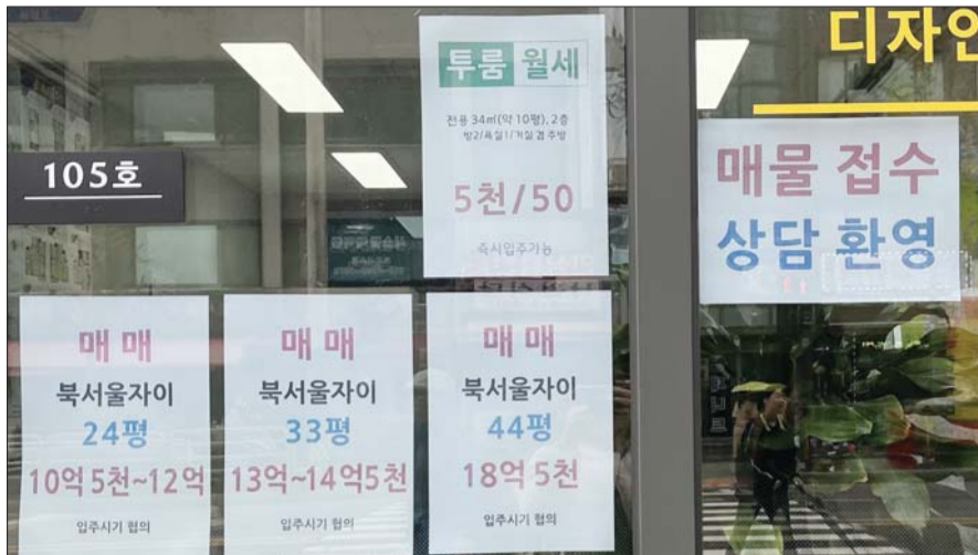
서울 강북구 미아동의 한 부동산중개업소에 매물 정보가 붙어 있다.

강북구 수유동 인근 한 부동산공인중개업소 관계자는 “20평대와 40평대 물건