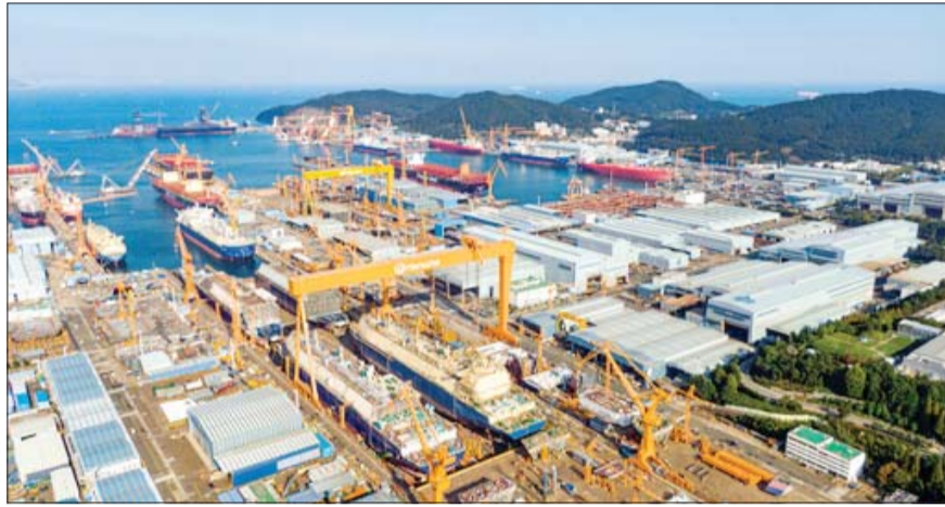
한화오션 거제사업장 전경.

한화오션 노조가 성과급 지급 기준 개선을 요구하면서 올해 임금·단체협약(임단협) 교섭에서 보상체계 개편 논의가 핵심 쟁점으로 부상하고 있다. 지난 2024년 노사 TF를 거쳐 제도 손질 논의가 이어져온 가운데 성과급 기준의 불투명성을 둘러싼 현장 문제 제기도 이어지고 있다.