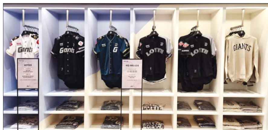
서울시 송파구에 위치한 잠실 롯데월드몰 3층에 오픈한 '롯데디자인즈x월비플레이'에 선보이는 디자인즈 유니폼 및 굿즈

11일 잠실 롯데월드몰 3층에 선보이는 '롯데디자인즈'의 공식 굿즈샵인 '롯데디자인즈x월비플레이'는 패션 그룹 형지의 스포츠 컬처 브랜드인 '월비플레이'와의 협업으로 롯데디자인즈 공인 굿즈를 비롯해 야구 용품까지 총망라한 '호텔 야구 굿즈샵'이다. 롯데디자인즈의 '유니폼' 등 의류와 함께 월비플레이의 배트백, 양말, 모자 등 '야구 용품'과