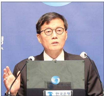
이창용 한국은행 총재가 10일 서울 중구 한국은행에서 열린 통화정책방향 기자회견에서 발언하고 있다.

실제 한은은 이번 회의에서 기준금리를 연 2.50%로 동결하면서도, 올해 성장률은 지난 2월 전망치(2.0%)를 하회하고 소비자물가 상승률은 2.2%를 상당폭