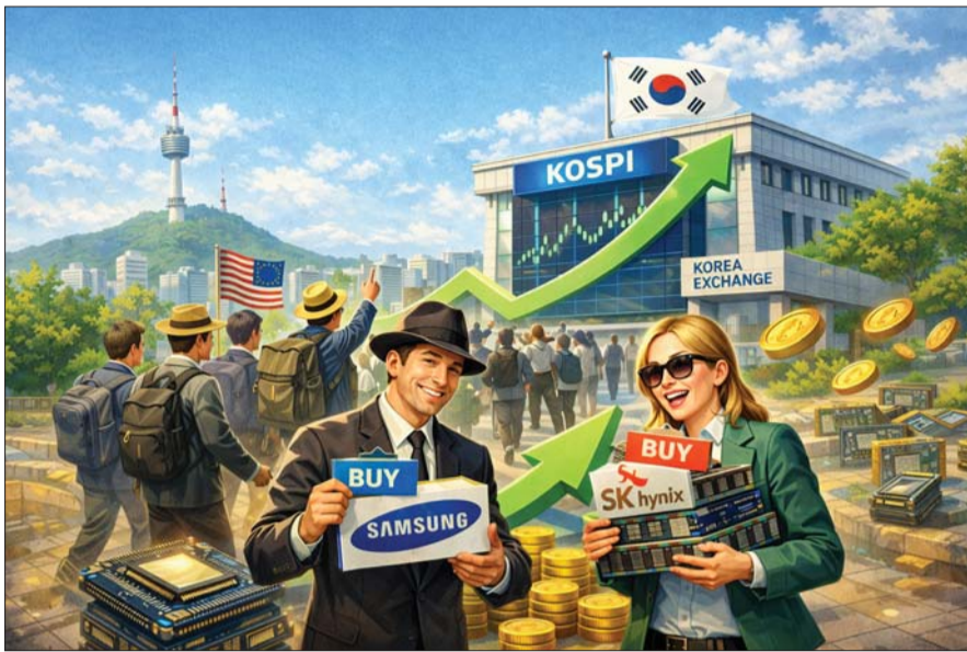
ChatGPT로 생성한 '삼성전자와 SK하이닉스를 순매수하며 코스피로 복귀하는 외국인 투자자' 관련 이미지.

외국인이 최근 반도체주에 다시 관심을 갖는 이유는 반도체 업황이 좋기 때