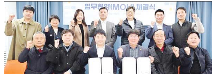
SOOP이 최근 서울시수영연맹, 안산시수영연맹과 수영 콘텐츠 제작 및 대회 중계 협력을 위한 업무협약(MOU)을 체결했다. /SOOP

업계는 이번 개편을 스트리밍 경쟁력 강화 움직임으로 본다. 국내 게임 스트리밍 시장에서 SOOP과 경쟁이 치열해지는 가운데, 네이버는 콘텐츠 접근성과 AI 추천을 결합해 이용자 체류 시간을 늘리는 전략을 택했다. /최빛나 기자