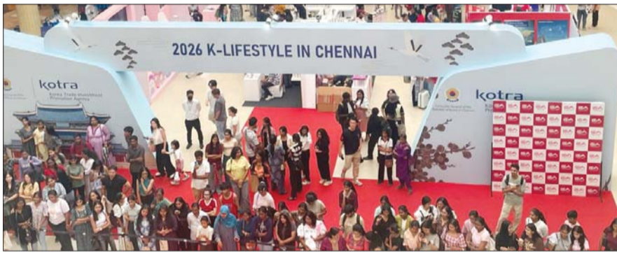
대한무역투자진흥공사(코트라)는 우리 기업의 인도 남부 시장 선점과 한국 문화 확산을 위해 현지시간 10일부터 이틀간 첸나이 최대 쇼핑몰인 '익스프레스 애비뉴 몰(Express Avenue Mall)'에서 '2026 K-라이프스타일 인 첸나이 (K-Lifestyle in Chennai)'를 개최했다.

'K-라이프스타일 인 첸나이' 열어 SM엔터 참여... 아티스트 IP 체험 문화 체험으로 브랜드 이미지 강화