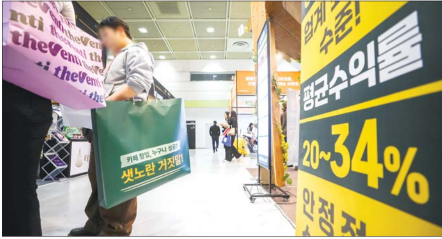
2일 서울 강남구 코엑스에서 열린 2026 상반기 IFS 프랜차이즈 창업·산업 박람회에서 참가자들이 창업상담을 받고 있다.

공정위 '지난해 가맹사업 현황 통계' 가맹점 평균 매출 3.7억... 4.3% ↑ 소상공인 1억9700만원... 2000만원 ↓