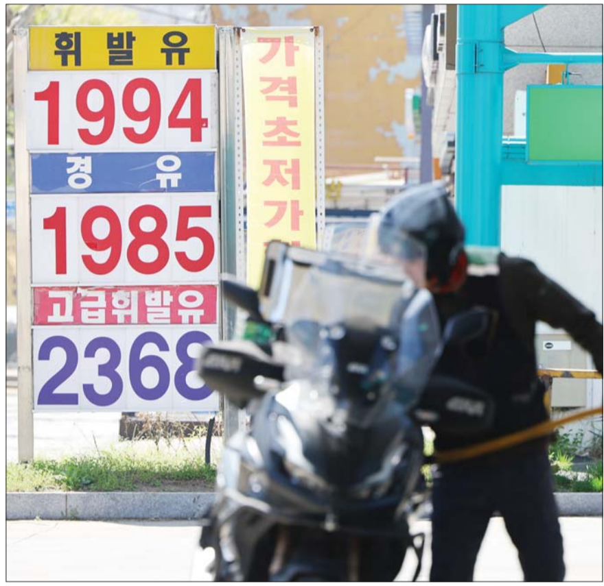
기름값 상승폭 둔화 12일 서울 시내 한 주유소에 유가 정보가 게시돼 있다. 이날 유가정보시스템 오피넷에 따르면 오전 9시 기준 전국 주유소 평균 휘발유값은 리터당 1992.3원으로 전날보다 0.7원 상승, 경유 가격은 1985.8원으로 0.6원 상승해 전국 주유소 평균 유가 상승세가 대폭 둔화한 것으로 나타났다.

증시로의 ‘머니 무브’ 행렬은 다양한 수치로도 나타난다. 지난해 297조였던 상장지수펀드(ETF) 순자산은 9일 기준