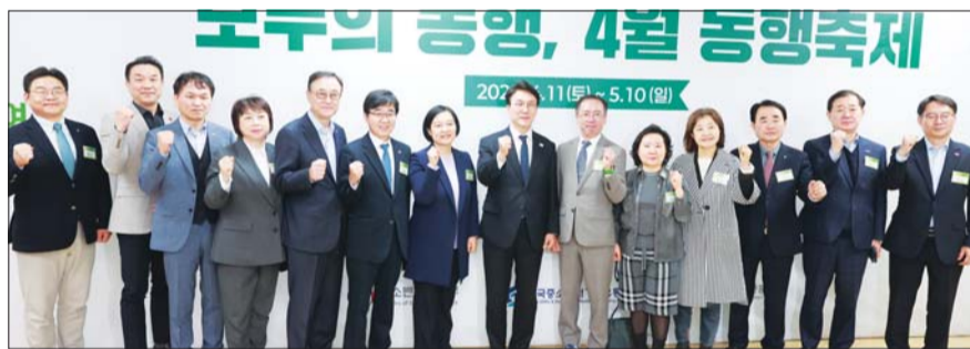
지난 11일 전북 전주시 전주실내체육관에서 열린 '4월 동행축제 개막식'에서 (왼쪽 다섯번째부터) 송치영 소상공인연합회장, 인태연 소상공인시장진흥공단 이사장, 한성숙 중소기업부 장관, 김민석 국무총리, 이충환 전국시장연합회장 등이 기념촬영을 하고 있다.

내국인의 지역 방문을 유도하고 지역 소비로도 이어지도록 전국 50개 지역축제와 연계하고 대형 유통사, 지역 소상공인과 협력해 준비한 우수 소상공인 판매전과 이벤트가 전국 방방곡곡에서 펼쳐진다.