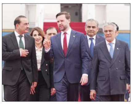
이란과의 종전 협상에 나선 JD 밴스 미국 부통령(가운데)이 11일(현지 시간) 파키스탄 이슬라마바드 공항에 도착해 아심 무니르 파키스탄 육군 참모총장(왼쪽)과 이샤크 다르 파키스탄 부총리 겸 외교장관과 함께 걸어가고 있다.