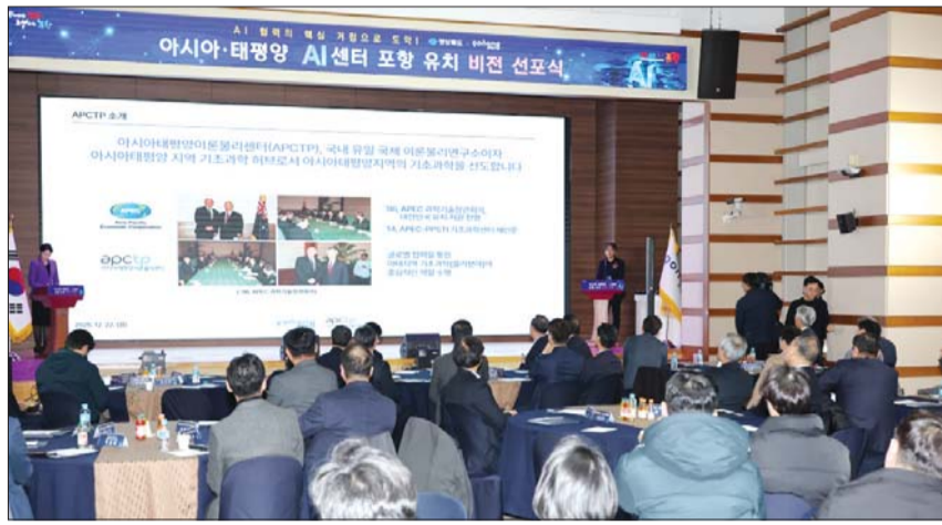
지난해 12월 열린 '아시아·태평양 AI센터 포항 유치 비전 선포식' 모습.

특히 시는 1996년 APEC 정상회의 를 계기로 설립된 아시아태평양이론물