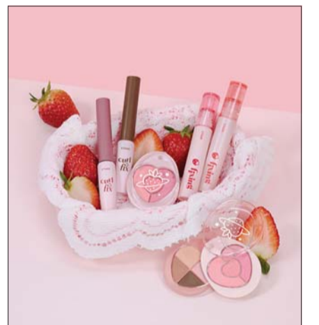
에뛰드 ‘딸기가 추구미’ /아모레퍼시픽

입술용 제품인 ‘픽싱 틴트’에서도 제품군을 확장했다. 딸기를 베어 문 듯 생기 있는 입술을 표현할 수 있고 취향에 따라 농도별로 선택할 수 있도록 신세