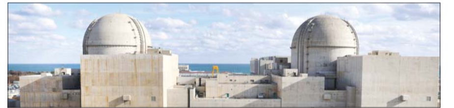
지난해 12월 촬영한 새울 3호기(오른쪽), 4호기 전경.

최근 중동 지역의 지정학적 리스크로 인해 국제 에너지 수급 불안이 고조되는 가운데, 이번 새울 3호기의 첫 시동은 국가 에너지 안보 측면에서 주목받고 있다. 원자력 발전은 타 에너지원에 비해 연료 수급이 안정적이고 가격 변동의 영향이 상대적으로 적은 에너지원으로 평가된다. /세종=한용수 기자