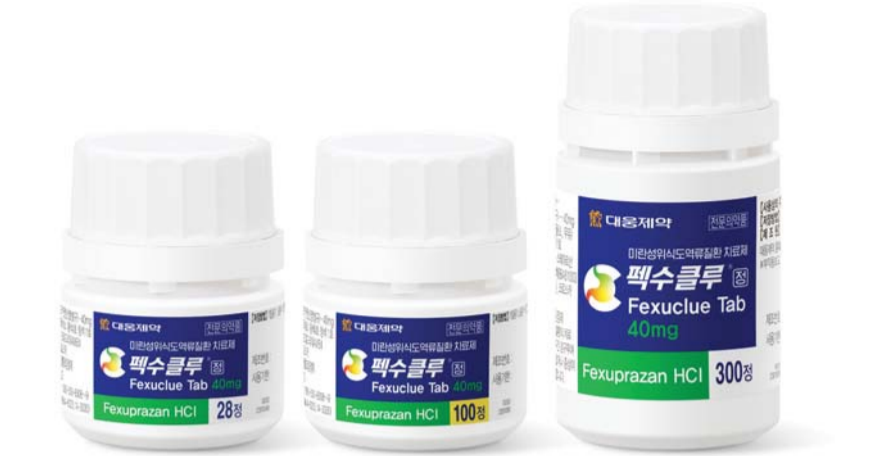
위식도역류질환 치료제 ‘펙수클루정’ 40mg /대웅제약

이번 임상은 약 21개월간 성인 위궤양 환자 총 384명에서 펙수클루 유효성, 안전성 등을 평가한다. 1차 유효성 평가 지표로, 8주 시점까지 위궤양 누적 치료율을 확인해 비열등성을 입증하는 것이 핵심이다. 임상 완료 후 품목허가