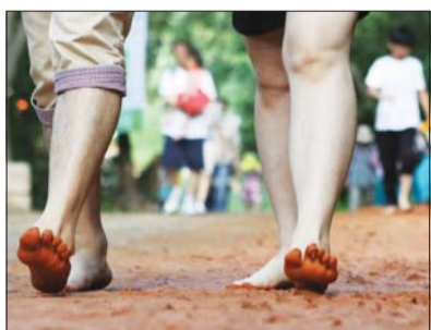
선양소주가 2019년 이후 7년 만에 '제15회 선양 계족산 맨발축제'를 재개최한다. /선양소주

유일의 맨발 달리기 대회인 '선양 마사이 마라톤'이 열린다. 아프리카 초원을 맨발로 거침없이 누비는 마사이족의 걸음에서 착안해 이름 붙여진 대회는, 신발을 벗어 던지고 붉은 황토길을 달리며 자신의 한계를 극복하는 이색 이벤트다. 참가자들은 발끝으로 자연의 감각을 느끼며 달리는 특별한 경험과 함께 색다른 성취감을 얻을 것으로 기대된다. /신원선 기자