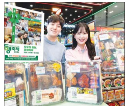
모델들이 세븐일레븐에서 동행축제 대상 품목을 소개하고 있다.

세븐일레븐은 도시락 구매 고객을 대상으로 경품 이벤트를 진행한다. 동행축제 대상 품목은 11찬도시락, 양반떡갈비&제육도시락, 반반제육&쏘야도시락, 고만할필요없는도시락 등 인기 도시락 4종이다. 모두 세븐일레븐