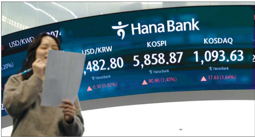
지난 10일 오후 서울 중구 하나은행 본점 딜링룸 전광판에 5858.87로 마감한 코스피 지수가 표시돼 있다.