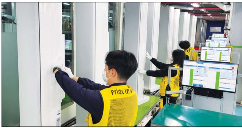
삼성전자가 다가오는 더위로 급증하는 에어컨 수요에 신속히 대응하기 위해 에어컨 생산라인을 풀가동 했다.

2026년형 에어컨 신제품은 스탠드형 '비스포크 AI 무풍콤보 갤러리 프로'와 벽걸이형 '비스포크 AI 무풍콤보 프로 벽걸이' 2종이다.