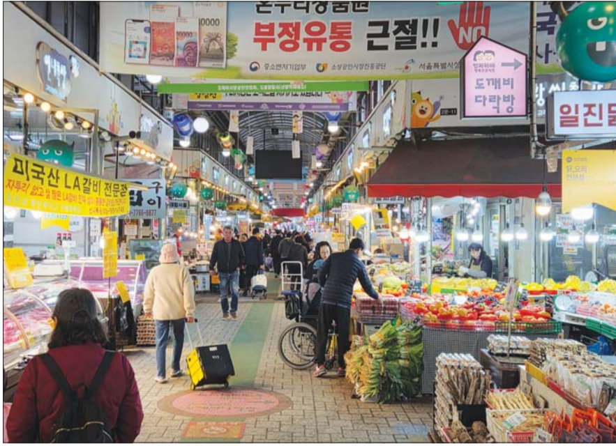
앞으로 연매출 30억원이 넘는 사업장은 온누리상품권 가맹점 등록이 제한된다. 서울 도봉구에 있는 한 전통시장 전경.

중기부, 전통시장법 시행령 입법예고 가맹점 등록제한업종 33개로 확대 부정 유통 시 과태료·과징금 강화 미등록 수취 댄 최대 2000만원 부과