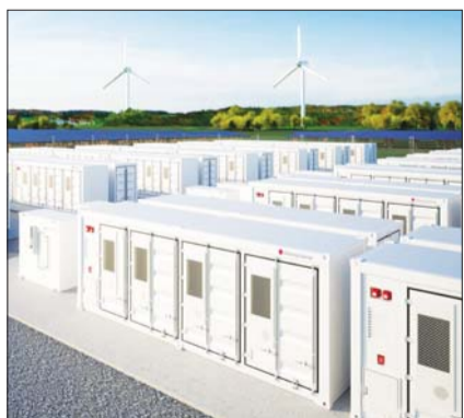
LG에너지솔루션 ESS 전력망 컨테이너 제품.

1분기 영업손실 207억원 기록 미시간 홀랜드 공장 체질 전환 유럽 공급망 재편 수혜 기대