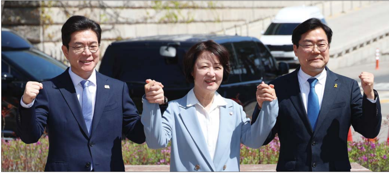
더불어민주당 정원오 서울시장 후보, 추미애 경기도지사 후보, 박찬대 인천시장 후보가 12일 서울 여의도 국회 소통관 앞 벤치에서 열린 수도권 광역단체장 후보 ‘원팀 간담회’에서 기념촬영을 하고 있다.

광역단체장 후보 3인은 민주당이 함께 할 때 가장 강하다는 것을 다시 확인했다”며 “서울·경기·인천의 협력을 통해 지방선거에서 승리하고, 이재명 정부의 성공을 든든히 뒷받침하기 위해 뜻을 모았다”고 말했다.