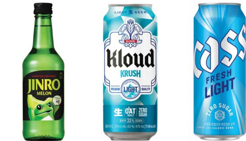
멜론에이슬 /하이트진로 클라우드 크러시 /롯데칠성음료 카스라이트 /오비맥주

기업들의 실적 흐름도 이를 반영한다. 금융감독원 전자공시시스템에 따르면 하이트진로는 지난해 연결 기준 매출 2조4986억원으로 전년 대비 3.