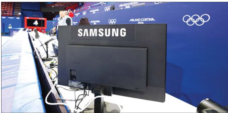
2026 밀라노 코르티나 동계올림픽 쇼트트랙 경기장 필드 오브 플레이 구역에 삼성전자 37형 모니터 '뷰피니티 S8(S80UD)'가 설치됐다.

쇼트트랙 경기에서 심판이 비디오 판정을 진행하는 '필드 오브 플레이' 구역에는 37형 모니터 '뷰피니티 S8(S80UD)'가 설치됐다. 현장에 제공되는 '뷰피