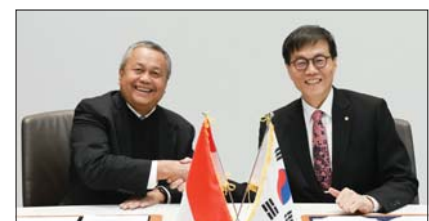
페리 와르지요 인도네시아 중앙은행 총재(왼쪽)와 이창용 한국은행 총재가 원·루피아 통화스왑 계약을 5년 연장하고 기념촬영을 하고 있다.

5일 한국은행은 이창용 총재와 페리 와르지요(Perry Warjiyo) 인도네시아 중앙은행 총재가 원·루피아 통화스왑 계약을 2026년 3월 6일부터 2031년 3월 5일까지 5년 연장하기로 했다고 밝혔다. 이에 따라 양국 중앙은행은 10조7000억원·115조 루피아까지 상호