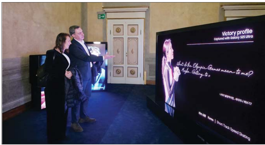
4일(현지시간) 이탈리아 밀라노의 유서 깊은 건축물인 팔라초 세르벨로니에서 진행된 ‘삼성 하우스’