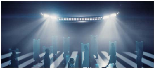
이동 경험의 전부를 바꾸는 | 자율주행 솔루션 |