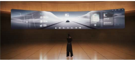
시각 경험의 전부를 바꾸는 | IVI 솔루션 |