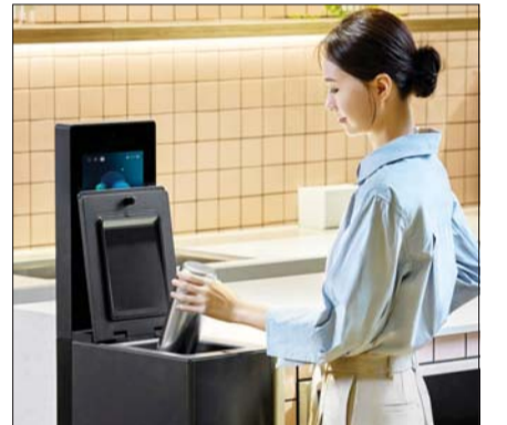
LG전자 모델이 마이컵으로 텀블러를 세척하는 모습.

고 연내 전국 2000여 개 모든 스타벅스 매장에 마이컵을 순차 설치할 예정이다. 또 최근 경상남도 및 낙동강유역환경청과 ‘일회용 컵 없는 공공기관 실현을 위한 대화용 컵 사용문화 확산 업무협약’을 맺었다.