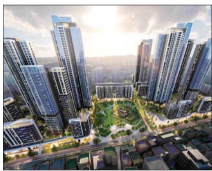
장위8 공공재개발 조감도. /삼성물산

장위8구역 공공재개발은 서울 성북구 장위동 일대 12만1634㎡ 부지에 지하3층~지상46층 규모의 총 21개동, 2801가구와 부대복지시설 등을 조성하