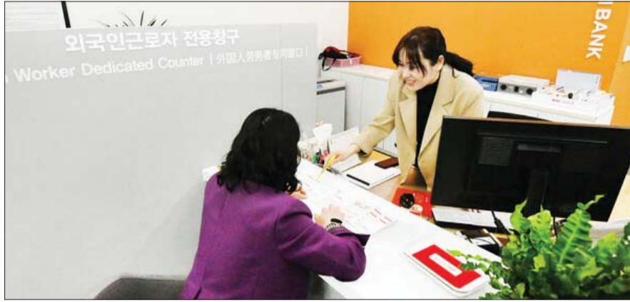
BNK경남은행 '외국인 근로자 전용 창구'에서 다문화 가정 직원이 외국인 고객과 상담을 진행하고 있다.

경제 활동을 위해 국내에 체류하는 외국인이 늘면서 금융거래도 늘었다. 금융감독원에 따르면 지난해 국내 은행