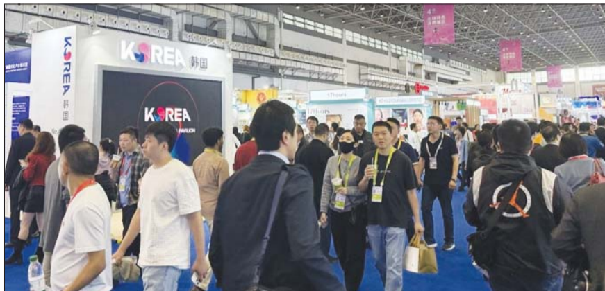
'중국 국제 소비재박람회' 한국관 운영 모습.

한국관은 ▲기업 전시관 ▲프리미엄 소비재 쇼케이스 ▲전자상거래 플랫폼 입점 상담회 ▲방향 관광 및 K-콘텐츠 홍보존 등으로 구성됐으며, 뷰티, 건강 식품 등 프리미엄 소비재 우리기업 45개사가 참가했다.