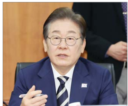
이재명 제21대 대통령 선거 더불어민주당 경선 후보가 21일 서울 여의도 금융투자협회에서 열린 자본시장 활성화를 위한 정책간담회에서 질의응답을 하고 있다.

이 후보는 21일 서울 여의도 금융투자협회에서 열린 '자본시장 활성화를 위한 정책간담회'에 참석해 "대한민국 경제가 일시적 침체를 넘어 구조적 위험에 처해 있다"며 "자본시장이 정상화되고