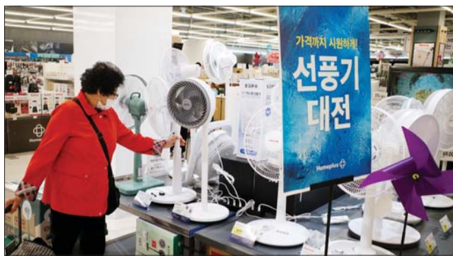
고객이 서울 시내 한 마트에서 선풍기를 살펴보고 있다.

이상기후가 유통업계의 판도를 바꾸고 있다. 백화점 업계는 봄 간절기 의류 판매가 부진해 울상을 짓고 있는 반면, 가전양판업계는 이른 더위에 발맞춰 에어컨 판매전에 돌입하며 분주한 모습이다.