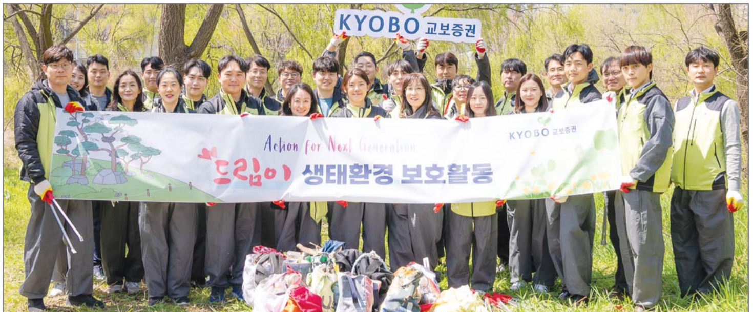
지난 4월 15일 서울 여의도공원에서 교보증권 임직원들이 플로깅을 진행하고 있다.

교보증권은 선도적으로 ESG(환경·사회·지배구조) 강화에 집중한 증권사 중 하나다. ESG를 단순한 기업 의무가 아닌 일상과 철학에서 우러나는 실천으로 접근하고 있다. 미래세대를 위한 '드림' 관련 프로젝트부터, 임직원들과 함께하는 ESG 기업 문화까지 다각도로 활동을 이어가고 있다. 2021년에 이사회 직속으로 ESG 위원회를 신설하는 등 ESG 경영을 적극적으로 실천하고 있다. 올해는 ▲미래세대 지원 ▲지역사회 연계 강화 ▲친환경 기업문화 조성 등 세가지 테마를 중심으로 ESG 역량을 집중할 계획이다.