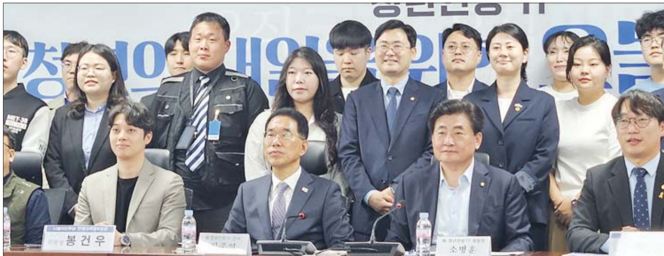
민주당 정년연장TF는 21일 오전 서울 여의도 국회 소통관에서 ‘청년의 내일을 위한 오늘의 질문’ 토론회를 열었다. 정년연장TF는 출범식 후 열린 첫 공식 토론회에서 자유토론을 하며, 정년 연장에 따른 질 좋은 일자리 감소 가능성을 우려하는 청년들의 목소리를 들었다.

‘일자리 감소 우려’ 청년 목소리 들어 정치권 “은퇴 이후 소득공백 메워야” 경영계 “노동시장 이중구조 심화” 청년 “모든 세대 공존할 수 있어야”