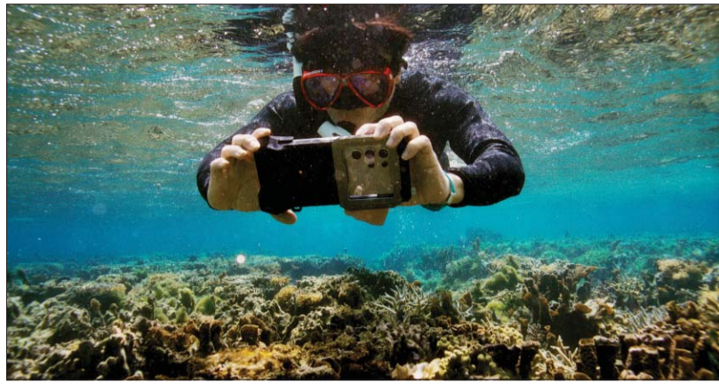
삼성전자가 해양 보호를 위해 갤럭시 카메라 기술을 활용한 해양 생태계 복원 프로젝트 '코랄 인 포커스(Coral in Focus)'를 위해 산호초를 찍고 있는 모습.

삼성전자가 갤럭시 카메라 기술을 활용해 1년 동안 농구장 25배 크기 면적의 산호초를 복원하는데 힘을 보탰다. 삼성전자는 지난해부터 미국 캘리포니아대학교 샌디에이고(UCSD)의 해양학 연구소 스크립스와 미국 비영리단체 시트리와 함께 진행 중인 해양 생태계 복원 프로젝트 '코랄 인 포커스'의 1주년 성과를 21일 공개했다. 이 프로젝트는 갤럭시 스마트폰으로 바닷속 산호초 사진을 촬영해 산호초의 현 상태를 모니터링하고 복원 활동에 기여하는 활동이다. 그동안 이 프로젝트를 통해 바닷속 생태계를 관찰하며 새롭게 심어