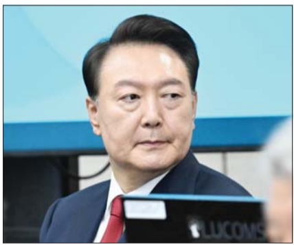
윤석열 전 대통령이 21일 서울 서초구 서울중앙지법에서 열린 내란 혐의 2차 공판에 참석하고 있다.

윤석열 전 대통령의 '내란 수괴(우두머리) 혐의' 2차 공판기일이 21일 열렸다. 법정에서 윤 전 대통령의 모습이 최초로 공개된 가운데, 대통령과 조성현 육군 수도방위사령부 제1경비단장(대령)은 '국회에서 의원을 끌어내리'는 지시를 받았다는 증언을 둘러싸고 공방을 벌였다.