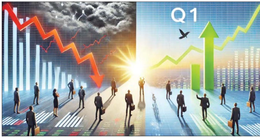
Chat GPT가 생성한 기업 실적 관련 이미지.

보면, 20여개 증권사가 예측한 1분기 현대차의 매출액(증권사 평균, 연결 기준)은 43조3323억원, 영업이익은 3조5945억원이다. 전년 같은 기간에 견줘 6.58%, 1.05% 증가한 수치다. 기아는 매출액이 전년보다 5.41% 늘어난 27조6321억원으로 집계됐다. 영업이익은 5.05% 감소한 3조2528억원이다.