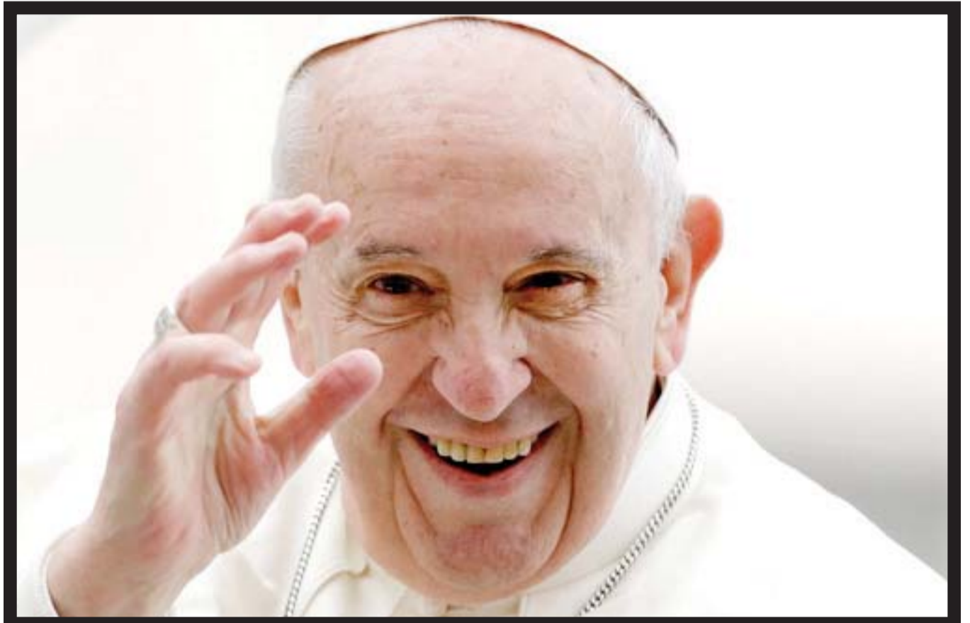
프란치스코 교황 선종... 향년 88세

고 부연구위원은 "추가적인 수요 유입은 제한적일 것으로 보이며 금융당국이 대출 규제 강화 기조를 지속하고