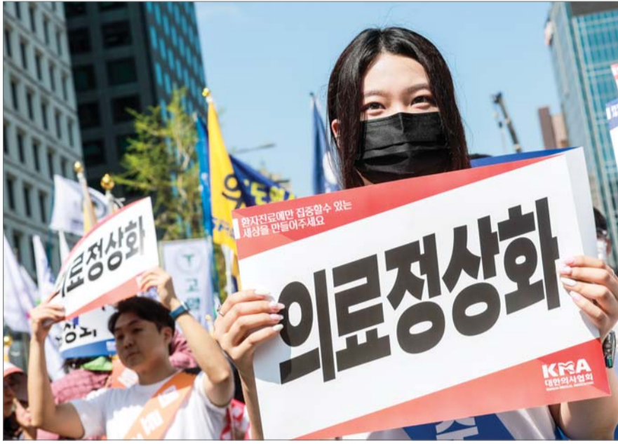
지난 20일 서울 중구 세종대로에서 열린 의료정상화를 위한 전국 의사결기대회에 참가한 의대생과 대한의사협회 관계자들이 피켓을 들고 있다.

앞서 교육부는 지난 17일 2026학년도 각 의과대학 모집 정원은 증원 전인 3058명으로 환원한다고 밝혔지만, 의대생들은 필수의료 정책 패키지 철회를 정부가 수용해야 수업에 참여하겠다는 입장이다. 특히, 2026학년도 모집인원 3058명은 한시적인 모집 인원에 불과하다면서 2027학년도 이후 의대 정원도