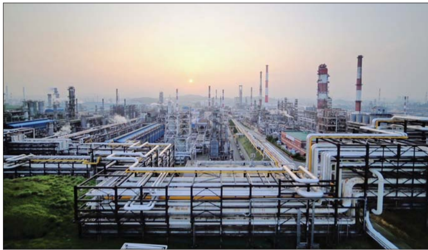
울산광역시 남구 고사동에 위치한 SK이노베이션 울산 콤플렉스 전경.

특히 석화 제품 운송 방식에 영향을 미칠 것이라는 의견이 팽배하다. 중국산 선박 이용에 따른 수출입 비용이 높아지면서 중국 제품의 가격 경쟁력이