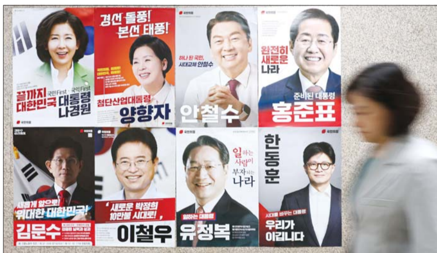
21일 서울 여의도 국회 국민의힘 사무실 앞에 대선 경선 후보자 포스터가 붙어있다.

이에 안철수·나경원 후보는 서로 거친 언사를 주고 받으며 존재감을 드러내고 있다. 안 후보는 이날 오전 국민의힘 대구시당 소회의실에서 기자회견을