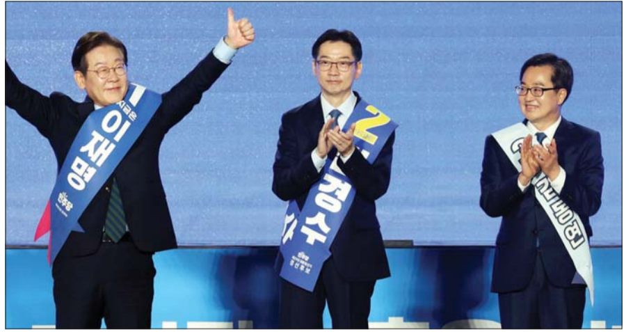
지난 19일 더불어민주당 대선 경선 후보들이 충북 청주시 서원구 청주체육관에서 열린 제21대 대통령선거 후보자 선출을 위한 충청권 합동연설회에서 지지자들에게 인사하고 있다. (왼쪽부터) 이재명, 김경수, 김동연 후보.

안철수 후보는 “다음 정부에서는 보건복지부를 두 개의 부서로 나눠 보건부와 질병관리청을 하나의 부서로 합치고, 나머지 부분은 복지부와 여성가족부를 포함해 새 부서를 신설해야 한다”면서 “해당 부서 내에 청년부를 신설해 (연금 문제를 비롯한) 청년 문제를