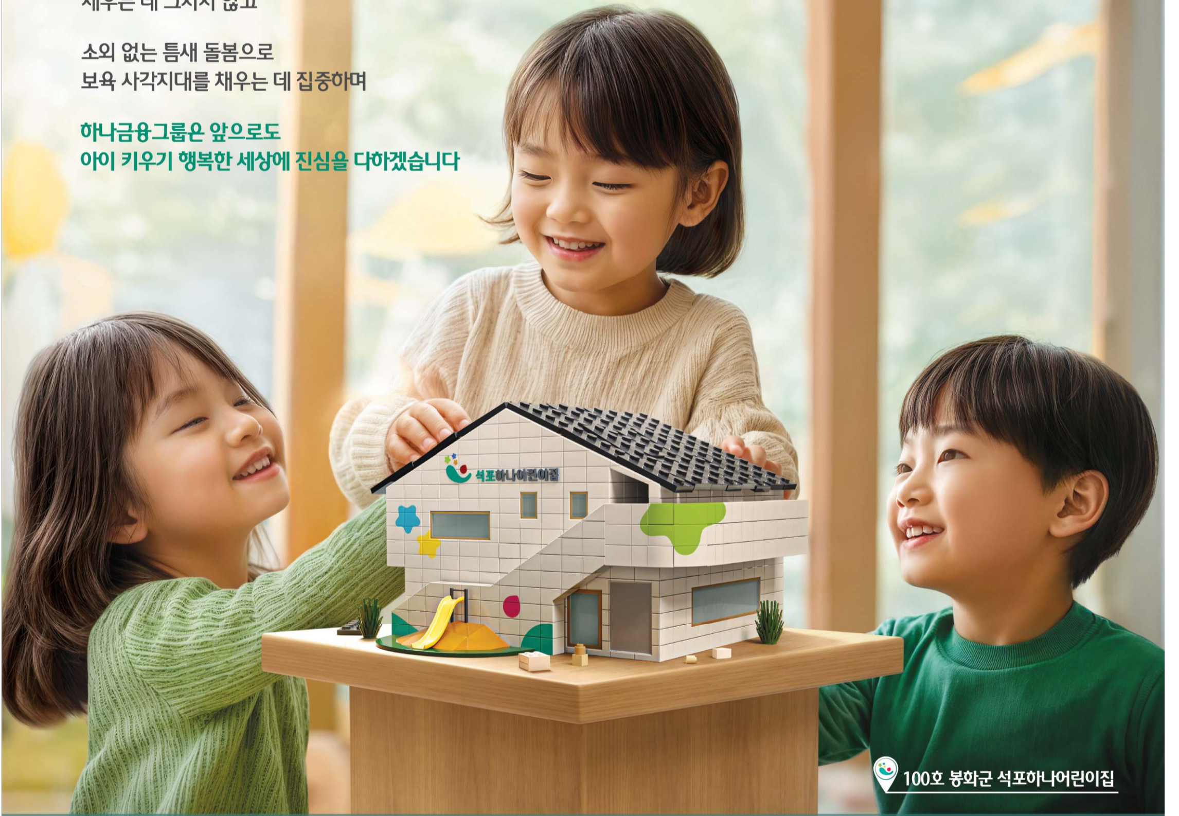
100호 봉화군 석포하나어린이집