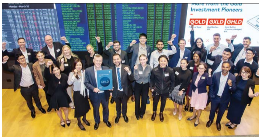
호주 증권거래소(ASX)에서 글로벌엑스 오스트레일리아의 ‘Global X Gold Bullion Currency Hedged (GHLD AU)’ 신규 상장을 기념해 진행된 오프닝벨 세레모니를 진행하고 있다.

인수 당시인 2022년 6월 46억4000만 호주달러였던 운용자산은 지난해 말 91억3000만 호주달러로 급증한 데 이어 최근 100억 호주달러를 돌파했다. 이에 따라 글로벌엑스 오스트레일리아는 뱅가드(Vanguard), 베타셰어즈(Betashares), 아이셰어즈(iShares), 반에크(VanEck)에 이어 호주 ETF 시장 내 5위