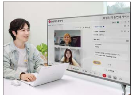
LG디스플레이 직원이 업계 최초로 도입한 AI 어시스턴트 서비스의 자동 통번역 기능을 이용해 유럽 및 베트남 법인과 화상회의를 하고 있다.

LG디스플레이는 AI 어시스턴트 서비스의 활용도를 높여 3년 내 업무 생산성을 30% 이상 높여간다는 방침이