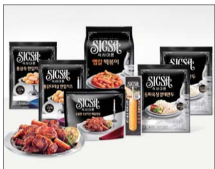
식사이론 제품 라인업 /롯데웰푸드

롯데웰푸드가 자사의 헬스&웰니스 간편식 브랜드 ‘식사이론(Theory of S ICSA)’을 통해 신제품 7종을 출시했다. 고물가와 경제적 불확실성 속에서 직접 식사를 준비하는 소비자가 늘어나는 데 따른 대응이다.