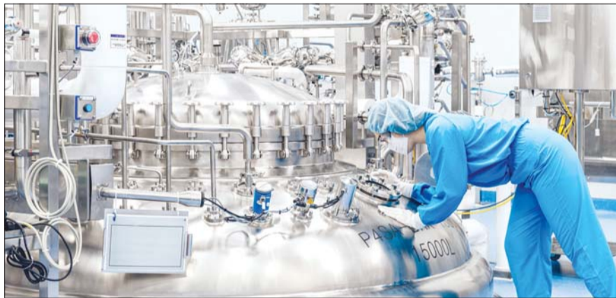
삼성바이오로직스 직원이 제4공장에서 배양기를 점검하고 있다.

내부적으로는 설립 초기 110여 명에 불과했던 임직원 수는 현재 약 5000명