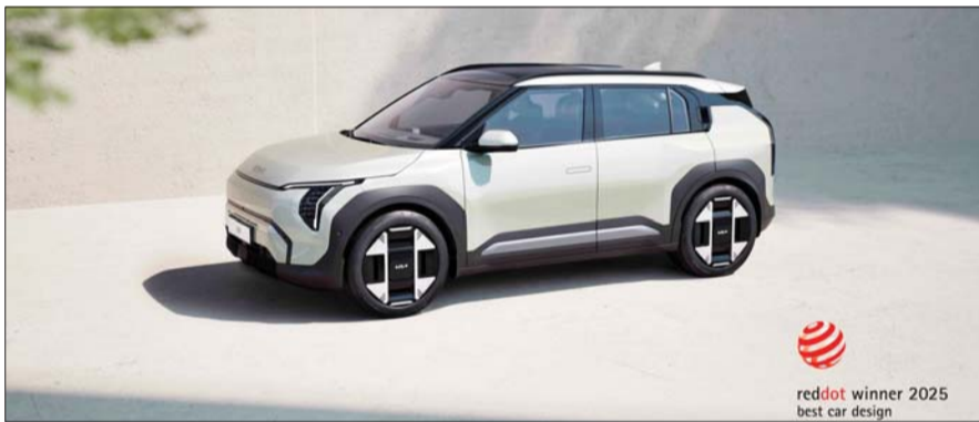
2025 레드 닷 어워드 최우수상 ‘EV3’

기아 EV3는 이번에 발표된 제품 디자인 부문에서 최우수상을 받았다. 현대차 아이오닉9와 디 올 뉴 팰리세이드, 스마트 택시 표시등, 가정용 전기차 충전기, 이피트(E-pit) 초고속 충전기,