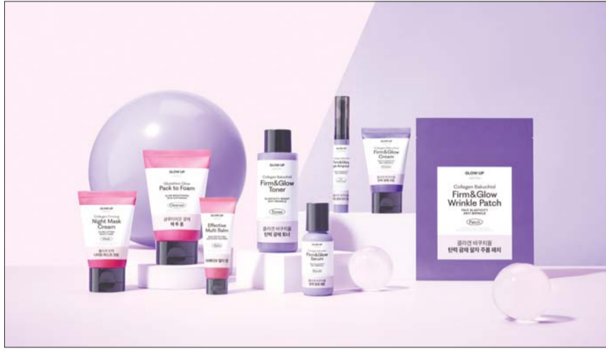
이마트 전용 브랜드 ‘글로우:업 바이 비온드’ 신제품 8종.

피부 탄력과 광채를 관리하는 토너, 크림, 세럼부터 360도 회전하는 볼을 내장해 눈가를 마사지할 수 있는 아이 엠