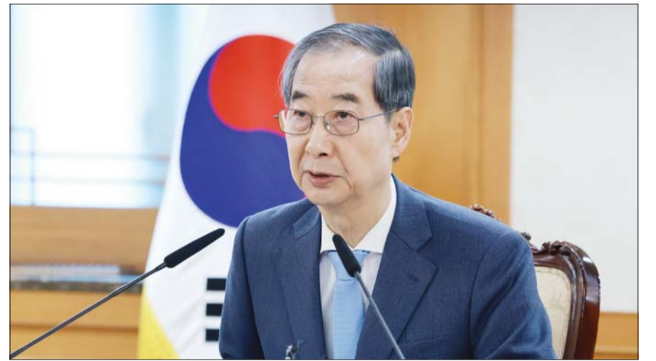
한덕수 대통령 권한대행 국무총리가 21일 정부서울청사에서 열린 경제안보전략 태스크포스(TF) 회의에서 발언하고 있다. /대통령실통신사진기자단

한편 이날은 첫 공판과 달리 공판 시작 전 언론에 형사대법정 사진 촬영과 영상 녹화를 허용해, 형사 법정에서 윤 전 대통령의 모습이 전국민에게 공개됐다. /서예진 기자 syj@