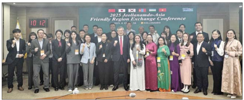
전남도-아시아 우호지역 교류회의 단체사진

올해로 7회를 맞는 김해독서대전은 '책 읽는 도시'를 주제로 강연, 공연, 전시, 북페어, 체험 등 60개의 다채로운 프로그램을 마련해 모든 세대가 함께 즐길 수 있는 독서문화 축제로 꾸며진다. /김해(경남)=이도식 기자